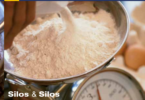
Silos & Silos